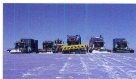
Kettenfahrzeuge auf dem Weg zur Kohlensta-tion.