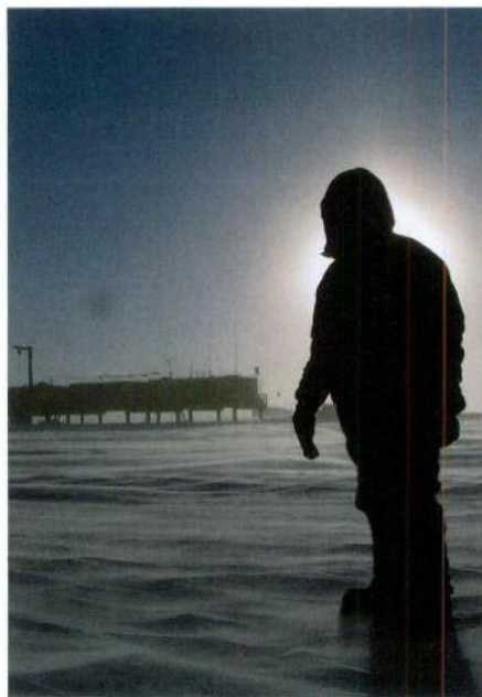
Polarforscher. Im Hintergrund die Kohnenstation.

Berner Klimaforscher, dass nicht nur das Eis selbst von Interesse ist, sondern dass im Eis auch Luft der Vergangenheit eingeschlossen ist. Diese Luft gestattet vor allem, die Konzentrationen der Treibhausgase Kohlendioxid, Methan oder auch Lachgas, die unsere heutige menschgemachte Erderwärmung verursachen, in der Vergangenheit zu bestimmen. Tatsächlich stammten alle Informationen zu den Änderungen dieser Treibhausgase vor den 1950er Jahren des letzten Jahrhunderts aus solchen Eiskernmessungen. Die Treibhausgas-Messungen an den EPICA-Eisbohrkernen, die federführend von den Berner Klimaphysikern und ihren Kollegen aus Grenoble durchgeführt wurden, zeigen, dass die heutigen CO 2 - und CH 4 -Konzentrationen nie zuvor in den