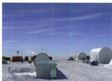
Eiskerncamp auf Dome C.